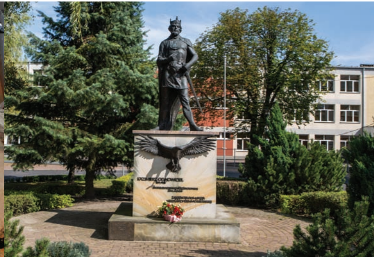
Pomnik Kazimierza Odnowiciela w Pobiedziskach

Zamek nie przetrwał w całości do naszych czasów, jego rewitalizacji dokonano w XXI w. Obecnie znajduje się w nim Muzeum Sztuk Użytkowych. Osobna sala ekspozycyjna poświęcona jest Przemysłowi II.