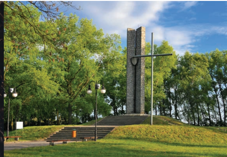
Pomnik upamiętniający bitwę pod Płowcami

By bliżej poznać historię grodu i jego rolę w państwie Piastów, warto zajrzeć do Muzeum Początków Państwa Polskiego w Gnieźnie.