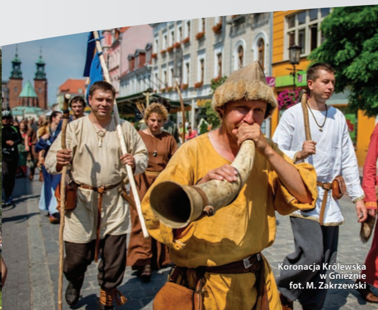
Koronacja Królewska w Gnieźnie