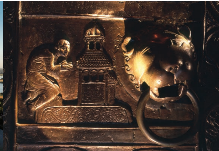
Fragment Drzwi Gnieźnieńskich

grodzie przebywały ówczesne elity, na czele z władcą i jego družyną. Gościł tu prawdopodobnie też cesarz Otton III podczas pielgrzymki do grobu św. Wojciecha .