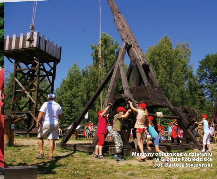
Maszyny oblężnicze w działaniu w Grodzie Pobiedziska