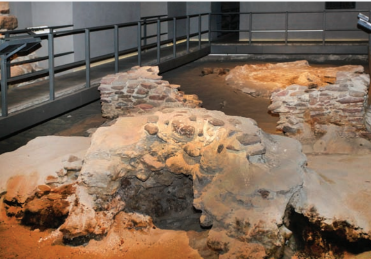
Relikwii grobów Mieszka I i Bolesława Chrobrego w podziemiach katedry poznańskiej

i śmierci. W kaplicy być może została pochowana Dobrawa , żona Mieszka I, a może i sam książę? Tego nie wiemy.