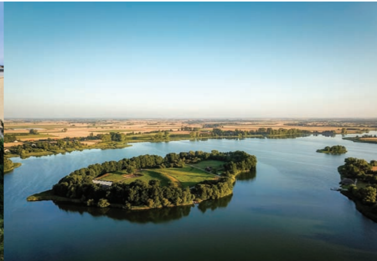
Ostrów Lednicki

Miasto kultywuje pamięć o Kazimierzu Odnowicielu , księciu, który odbudował w XI w. państwo zniszczone i rozbite w wyniku buntów poddanych i najazdu czeskiego księcia Brzetysława. Ponoć to w okolicy Pobiedzisk książę pokonał zbuntowanego Masława, dzięki czemu odzyskał Mazowsze. „Zdobyl zwycięstwo, pokój i cały kraj” – te słowa Galla Anonima o Kazimierzu Odnowicielu zacytowano na cokole pomnika księcia, który stoi w miasteczku.