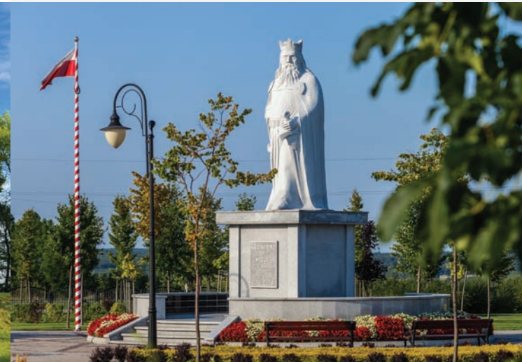
Pomnik Kazimierza Wielkiego w Kowalu

Kalisz – znany jest od starożytności. W IX w. powstał tu gród, który rozkwitł za panowania księcia Mieszka III Starego. Książę po śmierci spoczął w ufundowanej przez siebie kolegiacie św. Pawła. Miastem opiekowali się też inni piastowscy władcy, w tym Bolesław Pobożny, fundator świątyń, oraz Kazimierz Wielki, który wiele razy odwiedzał Kalisz i dbał o jego rozwój.