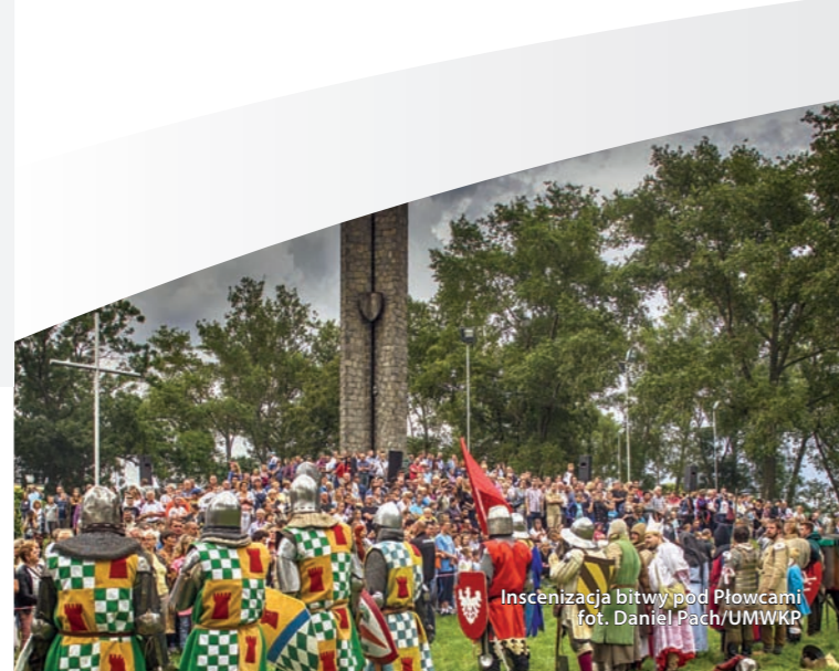
Inscenizacja bitwy pod Płowcami