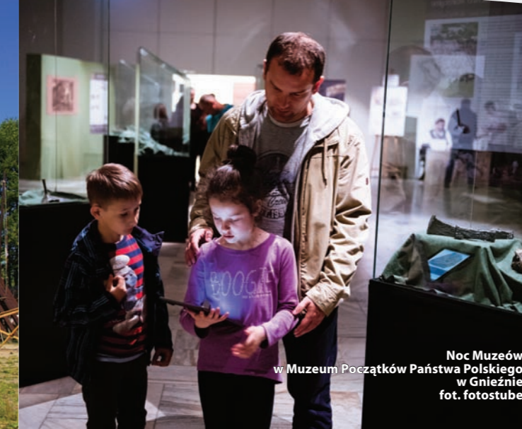
Noc Muzeów w Muzeum Początków Państwa Polskiego w Gnieźnie