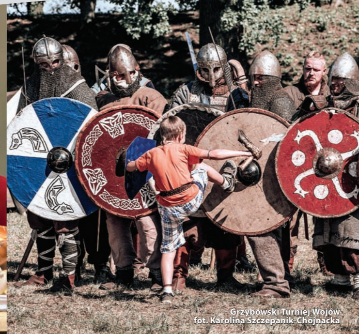
Grzybowski Turniej Wojów