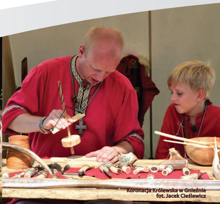
Koronacja Królewska w Gnieźnie