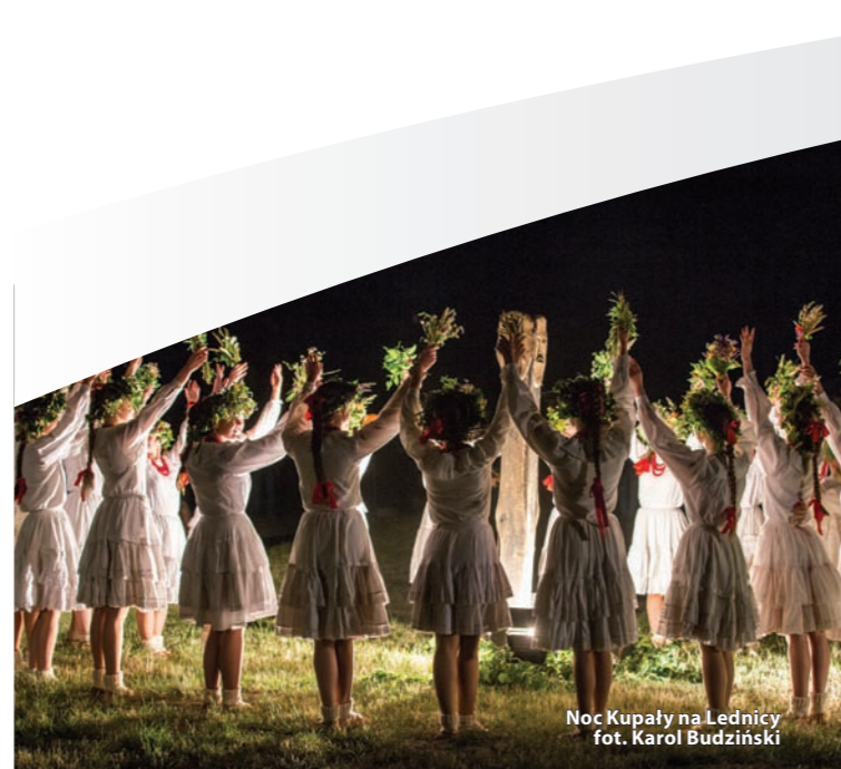
Noc Kupały na Lednicy