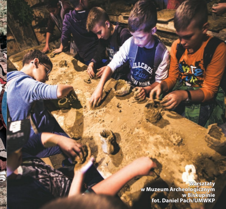
Warsztaty w Muzeum Archeologicznym w Biskupinie